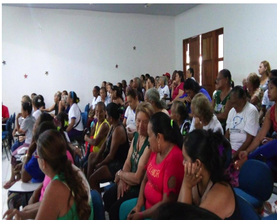
Figura 2: Reunião com a Rede de hospitais SARAH. Foto: Raysa Nascimento Junho/2015.

Após essa primeira aproximação, criou-se uma relação de confiança entre pesquisadora e interlocutoras e assim comecei a frequentar a casa das personagens principais deste ensaio. As parteiras 4 acompanhadas por mim foram Rai, Sá e Nazica, com 56, 75 e 88 anos de idade respectivamente. Dona Sá e dona Rai foram recomendadas pela presidente da associação. Dona Nazica selecionei dentre as parteiras com quem tive oportunidade de conversar em intervalos dos encontros que ocorrem na associação. Essas são consideradas