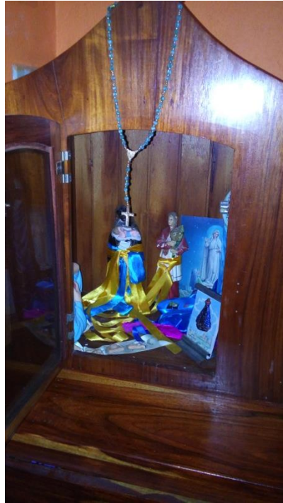
Figura 4: Altar presente no quarto que D. Rai faz seus atendimentos. Junho/2015.