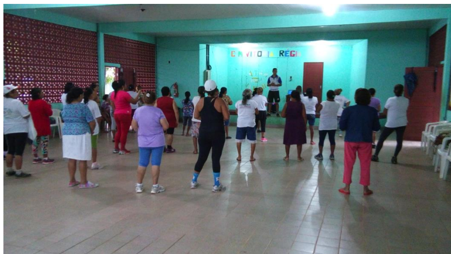
Figura 1: Parteiras em atividade física no Centro Vitória Régia. Foto: Raysa Nascimento, março/2015.