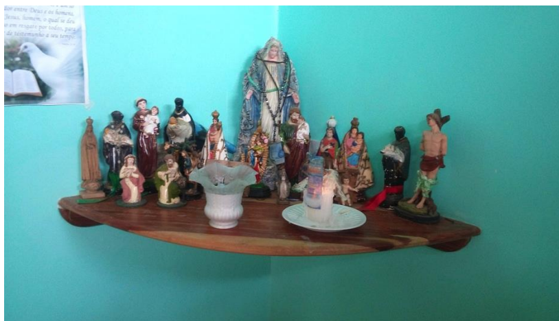
Figura 6: Altar na cozinha de D. Nazica. Foto: Raysa Nascimento, julho/2015.

Além de parteira é benzedeira. Também produz remédios caseiros para a comunidade e mulheres que acompanha. Em seu quintal têm algumas plantas e ervas que usa nessa produção dos remédios e das benzeções. É católica e em sua cozinha há um altar de santos cristãos, bem como em toda sua casa há imagens destes espalhados.