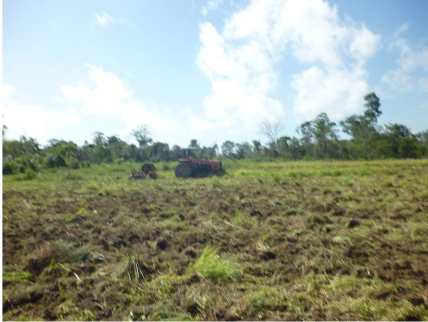
Imagem 15: Arado – roça no campo