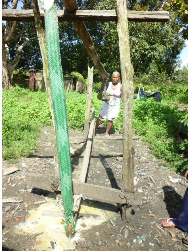
Imagem 13: Espremedor – instrumento que segura o tipiti para a prensa da mandioca