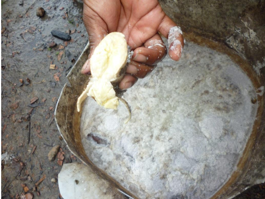
Imagem 11: Mandioca macerada – mandioca que fica imersa em água de três a cinco dias