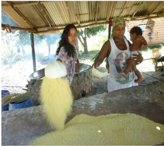
RETIRADA DA FARINHA PRONTA PARA A MACERA