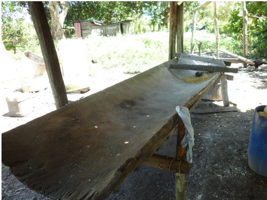
Imagem 10: Masseur – instrumento para receber as massas da mandioca