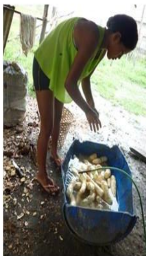
LAVAGEM DA MANDIOCA