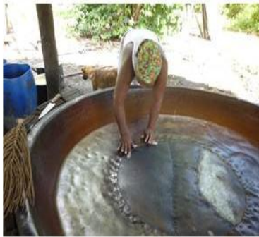
PROCESSO PARA UNTAR FORNO