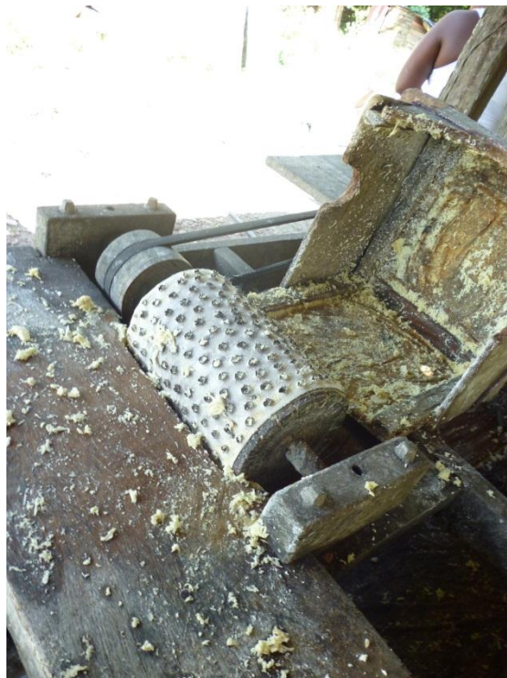
Imagem 2: Catitu – Ralo elétrico