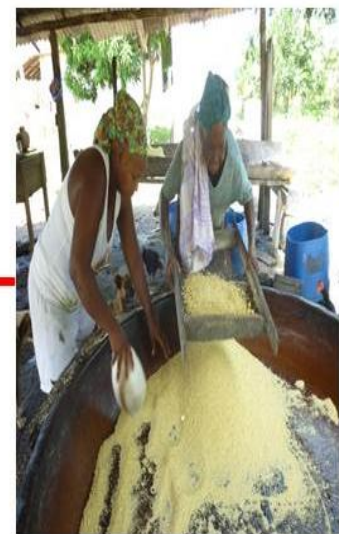
SEPARAÇÃO DA FARINHA E DO GRURULÃO