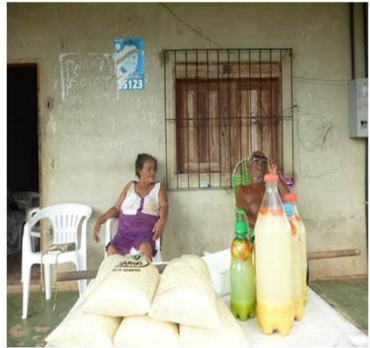
FARINHA E TUCUPI PRONTOS PARA CONSUMO