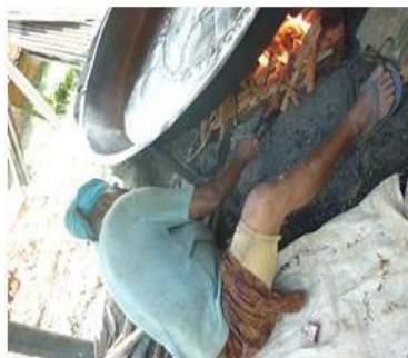
ACENDIMENTO DO FORNO