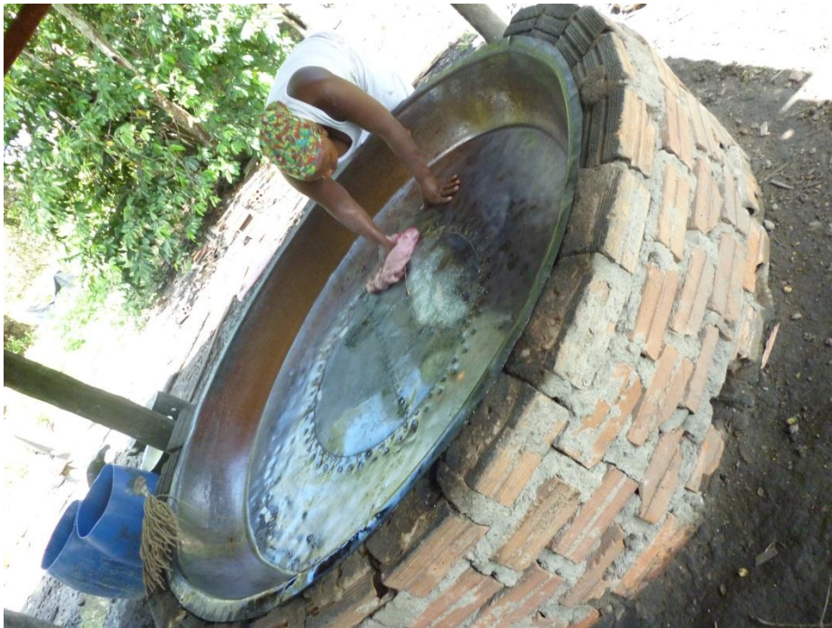
Imagem 12: Forno de cobre para torrar a farinha