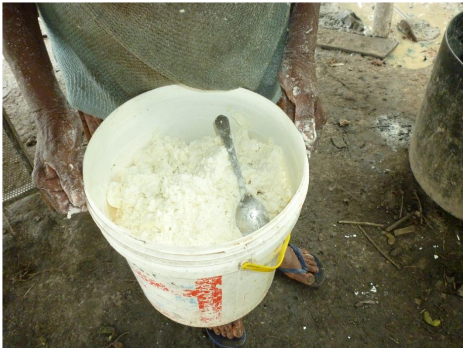
Imagem 8: Tapioca – parte sólida obtida após o repouso do tucupí no recipiente