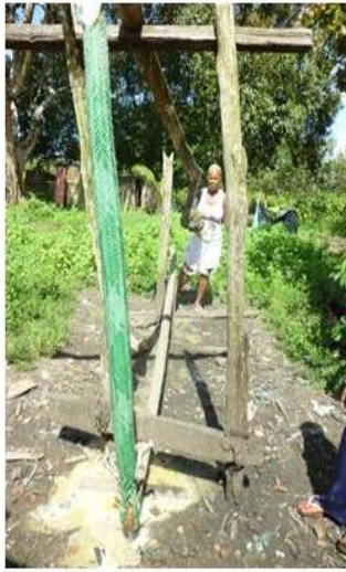
RETIRADA DO TUCUPÍ