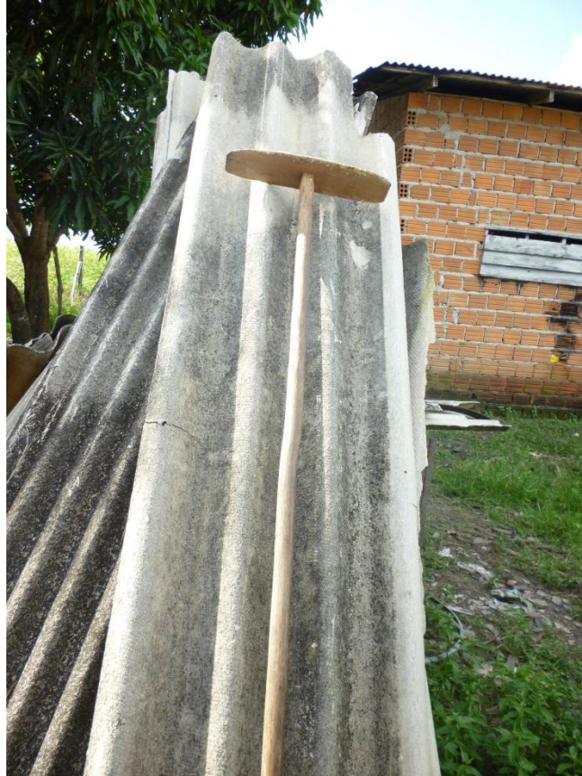
Imagem 9: Rodo – instrumento para mexer a farinha durante a torra