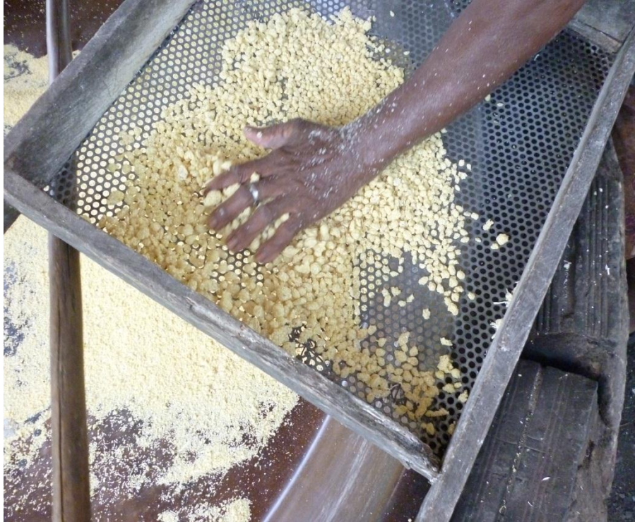
Imagem 7: Gurulão – farinha “embolada” no processo de torração