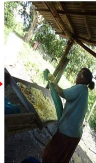
COLOCAÇÃO DA MASSA RALADA NO TIPITÍ