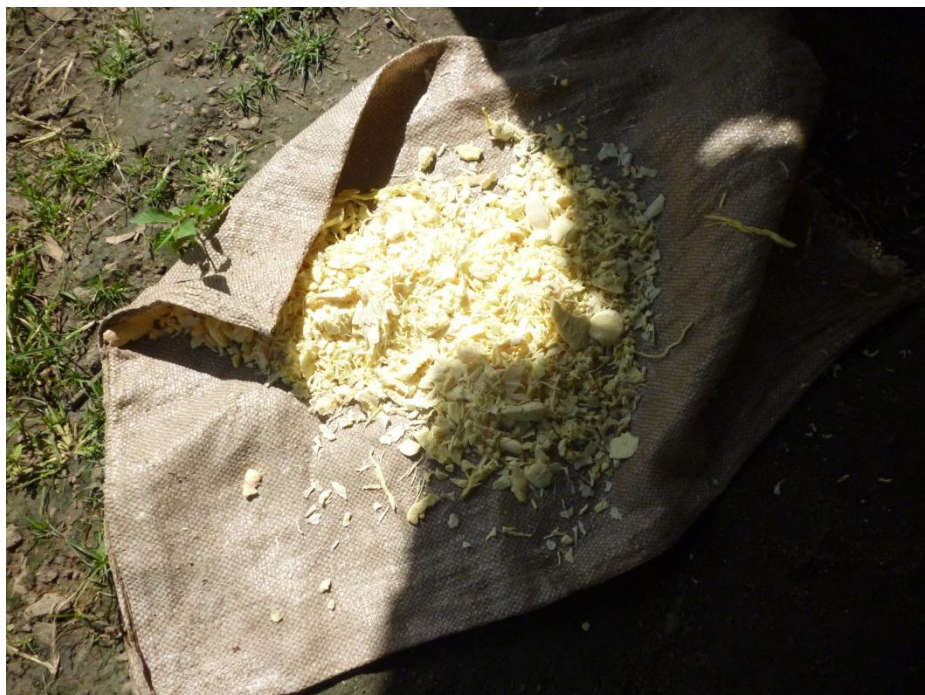
Imagem 6: Carueira – pedaços de mandioca não ralados