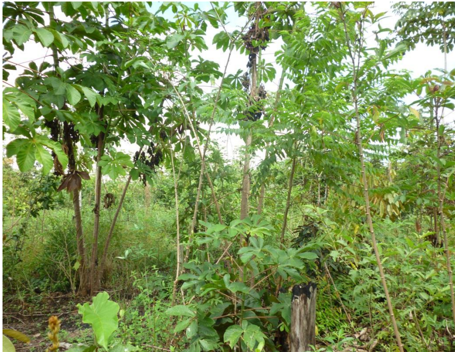
Imagem 14: Capoeira – local onde foram feitas as roças