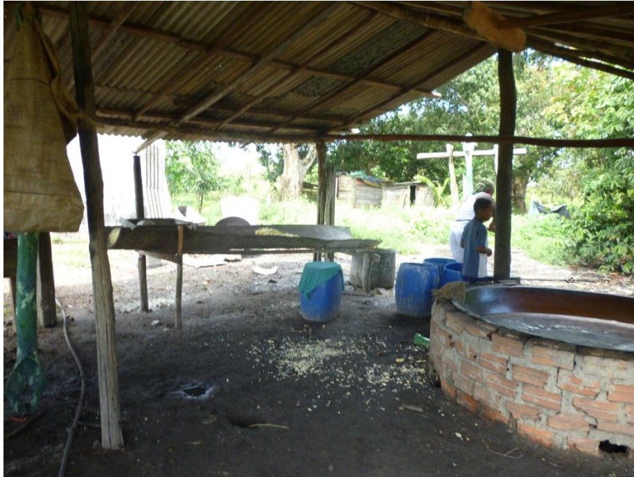
Imagem 1: “Caduforno” – casa de produção da farinha.