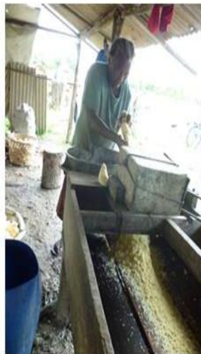
PROCESSO PARA RALAR