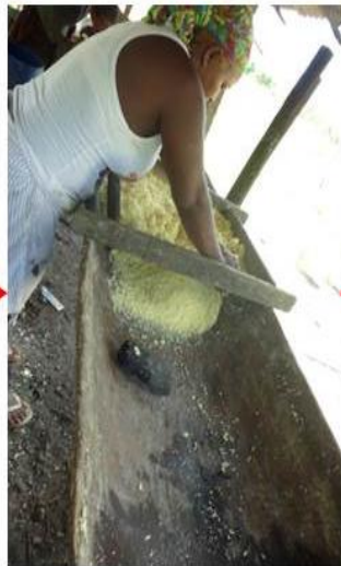
SELEÇÃO DA MANDIOCA RALADA E DA CARUEIRA