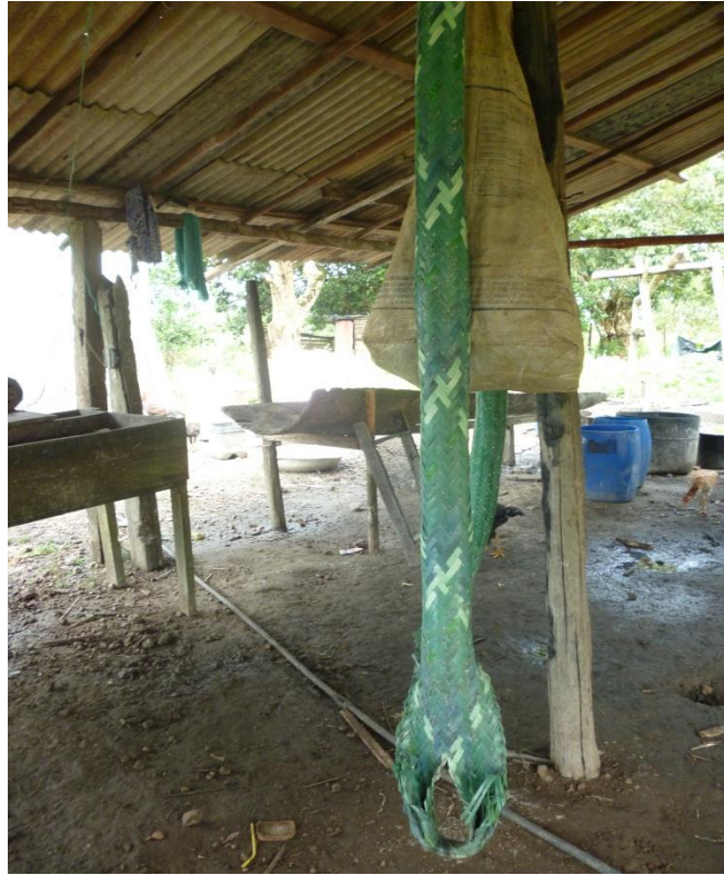
Imagem 3: Tipiti – instrumento para a prensa da mandioca ralada.