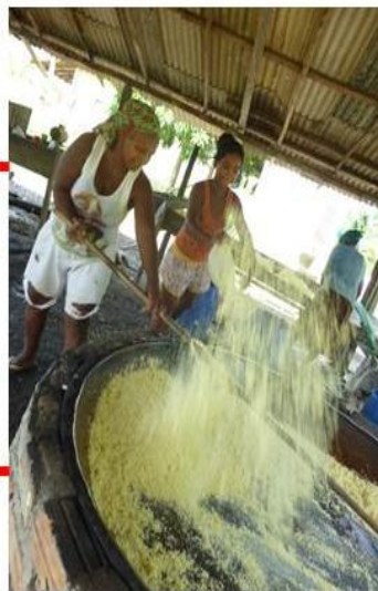
TORRA DA MASSA