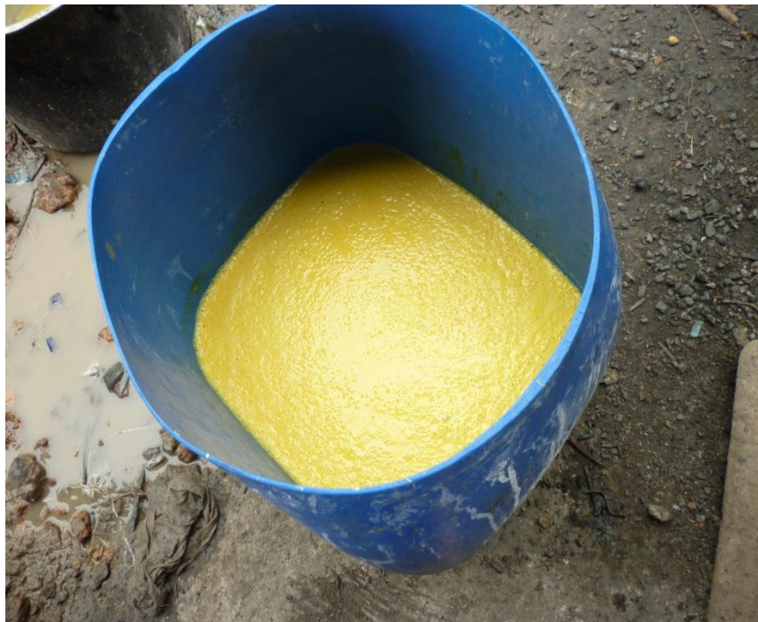
Imagem 4: Tucupi – líquido obtido através da massa da mandioca prensada