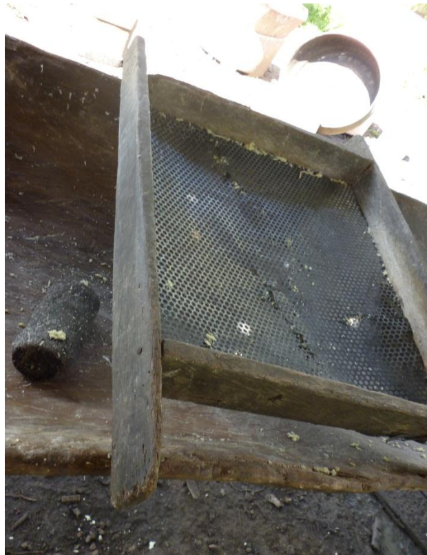
Imagem 5: Peneira – para separar a mandioca ralada e farinha quase pronta