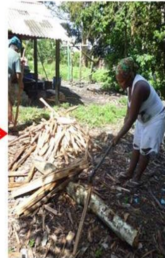
CORTE DE LENHA