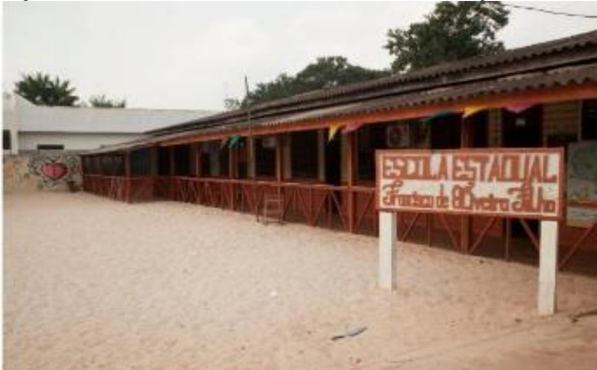
Imagem 01. E.E. Francisco de Oliveira Filho, na Comunidade do Rio do Anauerpucu, Santana-AP.