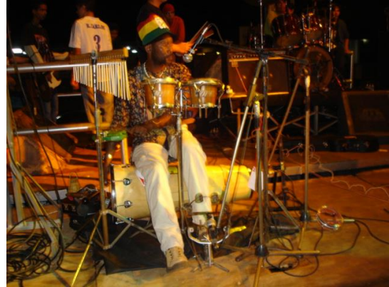
Marquinhos Roots/ Bandas Porto Reggae e Mano Roots