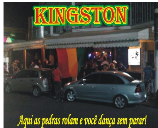
Bar Kingston Music/2013