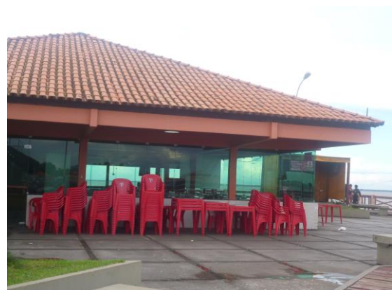
Restaurante do Trapiche