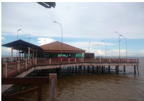
Lateral direita do Trapiche