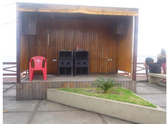
Palco onde os Dj's tocavam