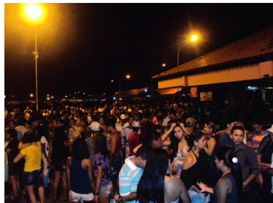
Público do Reggae do Bondinho