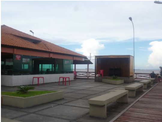
Espaço onde ocorria o Reggae do Bondinho