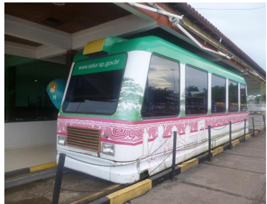
Bondinho Do Trapiche