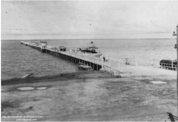
Trapiche Eliézer Levy na década de 1940