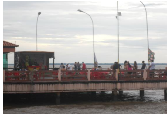
Reggae do Bondinho em dia de Tributo