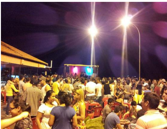
Reggae do Bondinho em noite de domingo