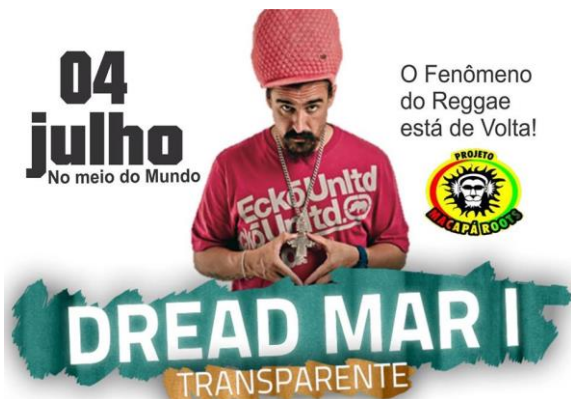
Propaganda do show do cantor argentino Dread Mar-i