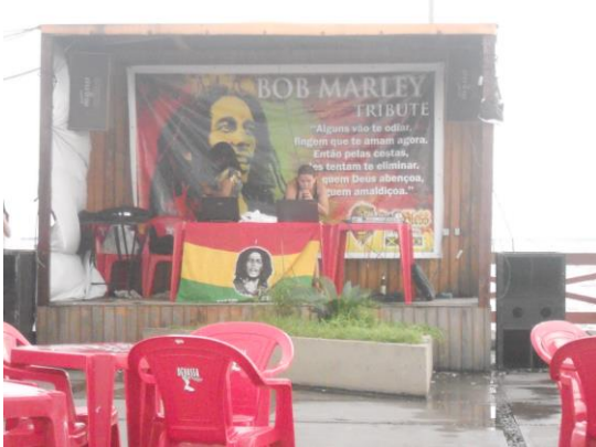
Espaço onde ocorria o Reggae do Bondinho