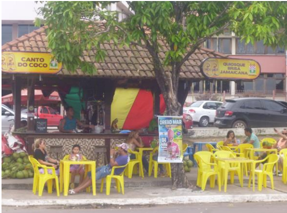
Quiosque Brisa Jamaicana na Praça do Côco