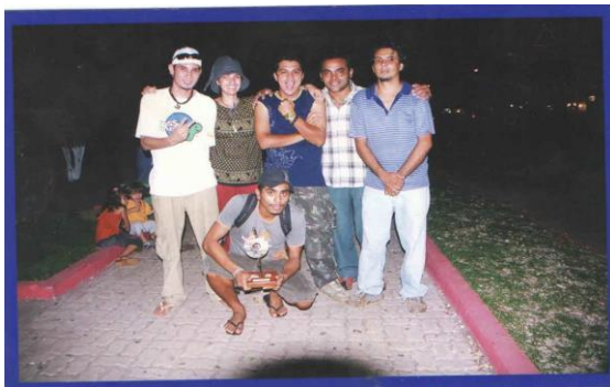
Integrantes da extinta banda Porto Reggae