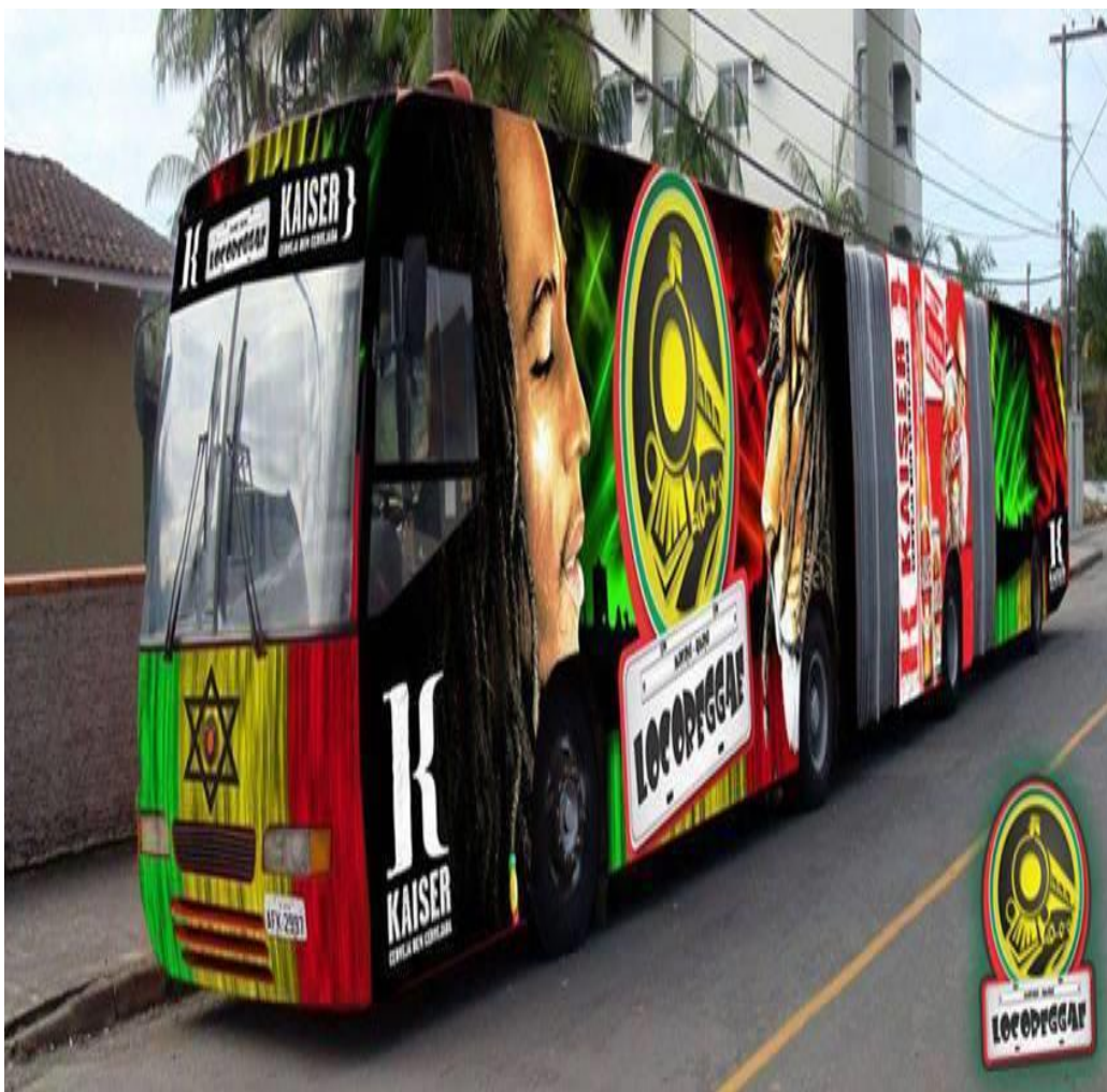
Ônibus da extinta Estação Locoreggae/2013