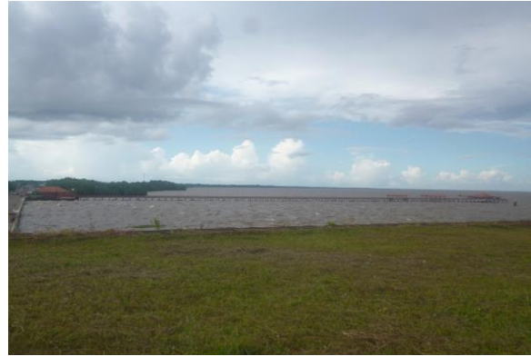
Trapiche atualmente