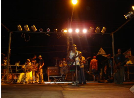
Extinta Banda Porto Reggae