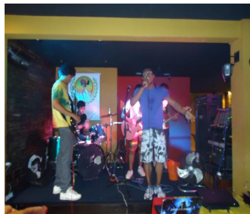
Banda de Reggae Local