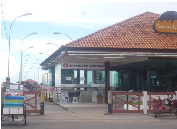
Entrada do Trapiche