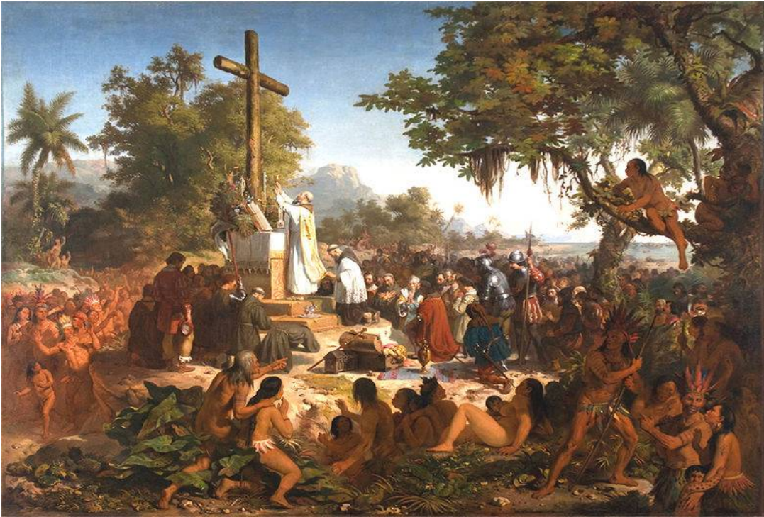
Victor Meirelles: A primeira Missa no Brasil , 1861. Museu Nacional de Belas Artes.