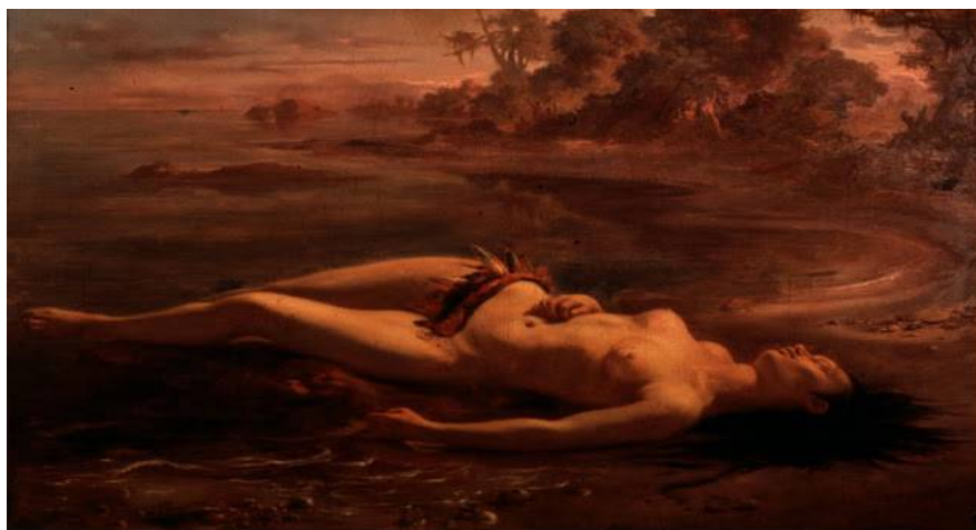
Victor Meirelles: Moema , 1866. Museu de Arte de São Paulo http://ricardomees.blogspot.com.br/2012/04/primeira-geracao-romantica.html