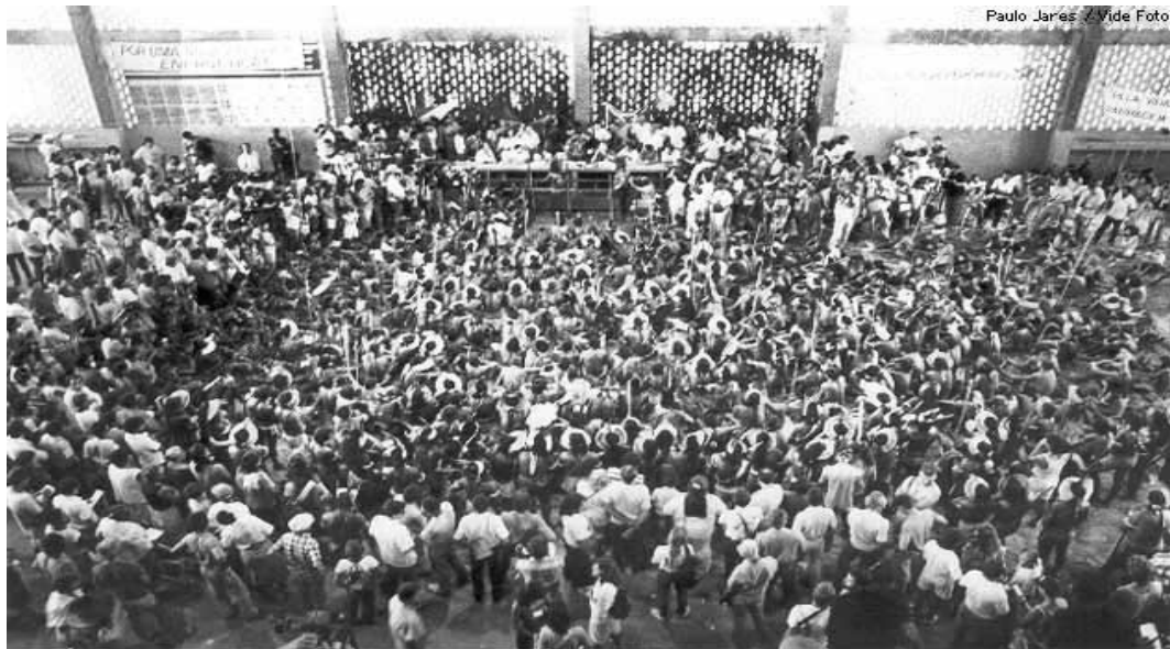
Paulo Jares - Vide Foto

I Encontro dos Povos Indígenas do Xingu reuniu três mil pessoas - 650 eram índios que se reuniram para mostrar ao mundo seu descontentamento com a política de construção de barragens no Rio Xingu em 20 e 25 de fevereiro de 1989, em Altamira (PA).