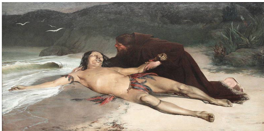
Rodolpho Amoedo. O último Tamoyo, 1883. Rio de Janeiro. Museu Nacional de Belas Artes.