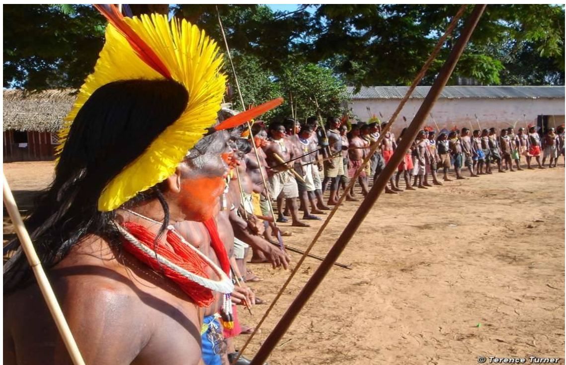
Índios Kayapó dançam em um protesto contra hidrelétricas, 2006

Imagem de Terence Turner. Fonte: http://www.survivalinternational.org/povos/indios-brasileiros