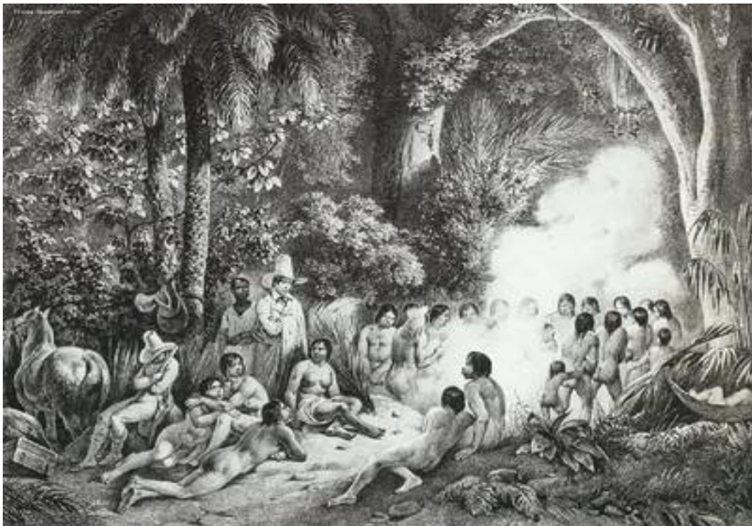
Johann Moritz Rugendas - Dança dos Puris, 1824.