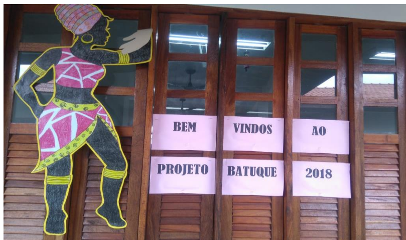
Figura 5 - Mural de recepção do Projeto Batuque 2018