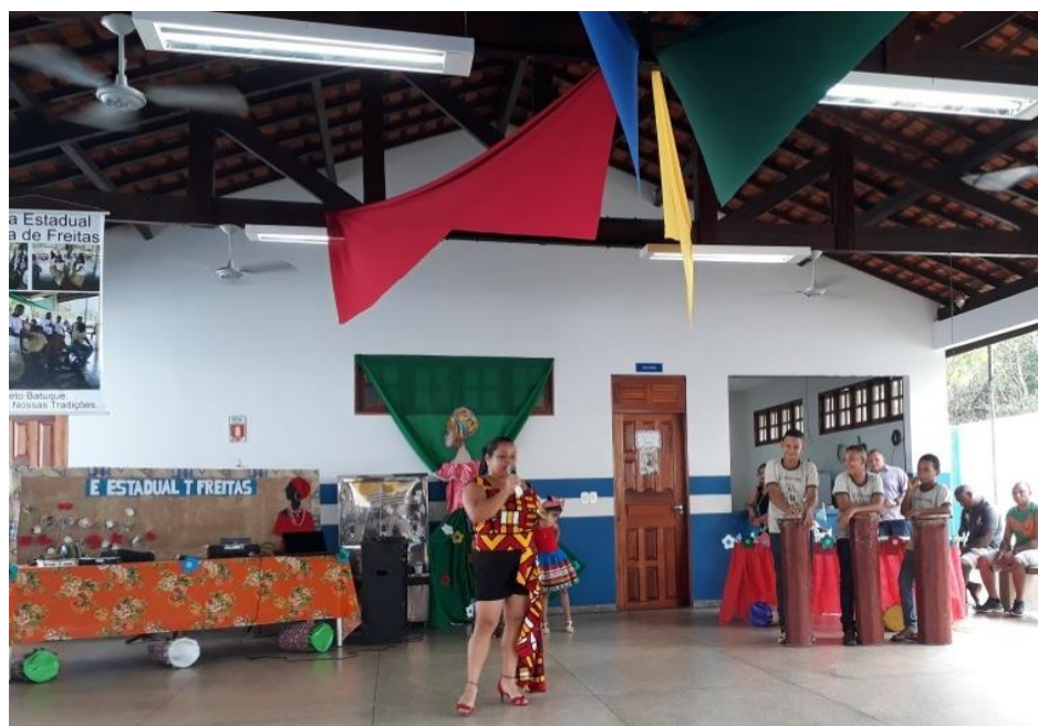
Figura 18 - Apresentação do Projeto Batuque