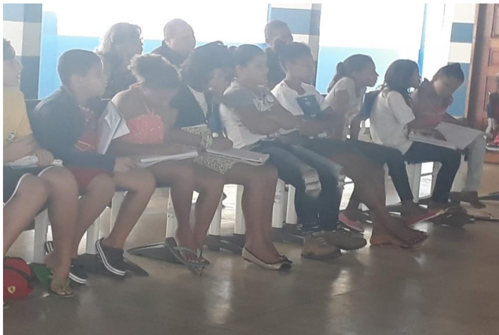
Figura 9 - Crianças da Escola Quilombola respondendo ao questionário.