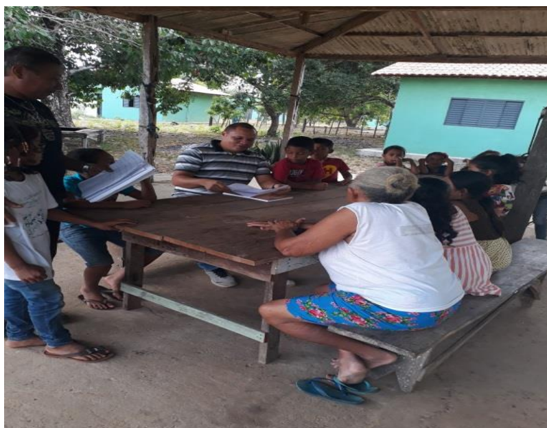
Figura 11 - Crianças do 3º ano entrevistando os mais velhos, sobre as festividades religiosas do Quilombo.