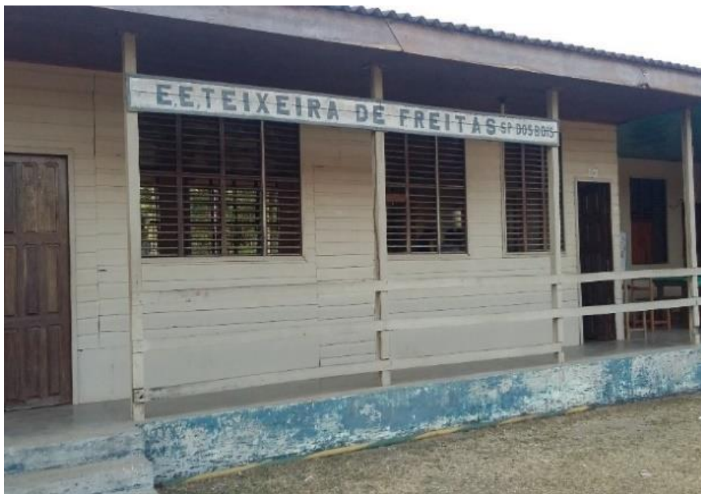
Figura 3 - Estrutura antiga da escola, 2017.