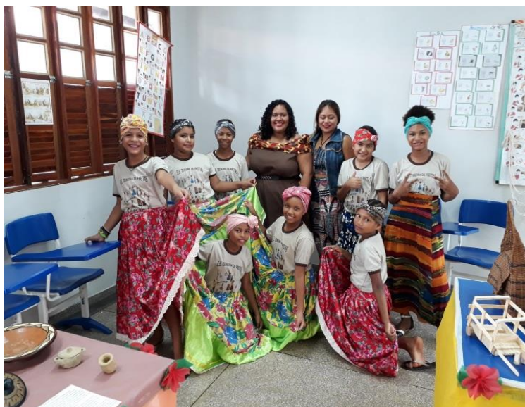
Figura 20 - Oficina de Turbante na turma do 4º ano