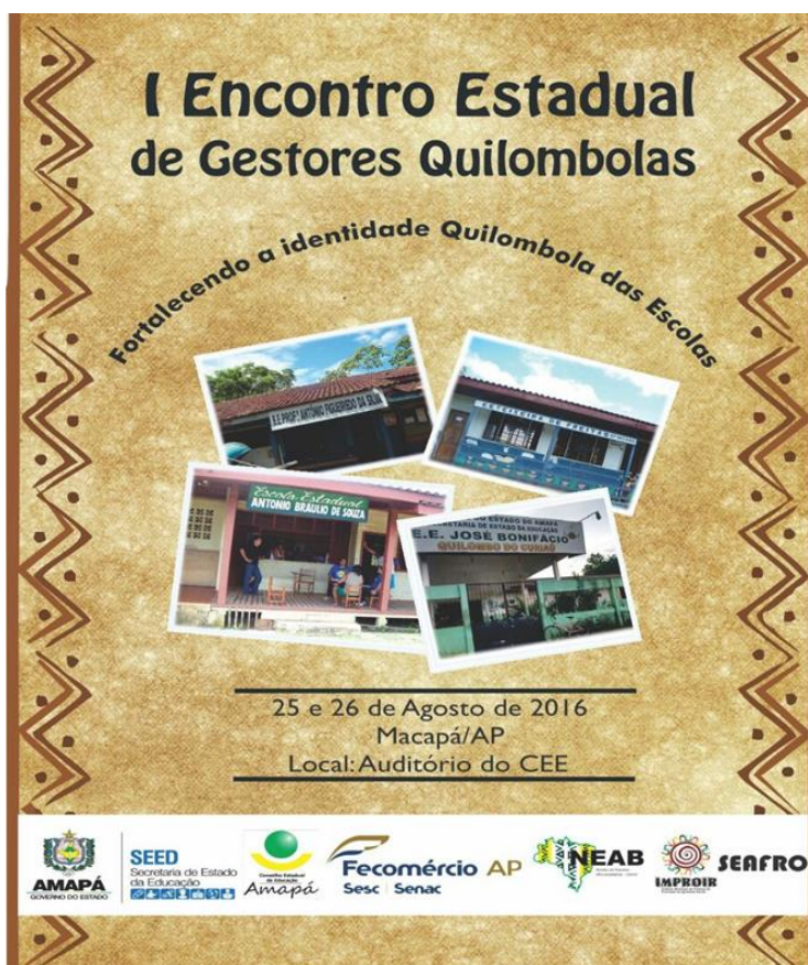
Figura 2- Banner de divulgação do I Encontro Estadual de Gestores Quilombolas