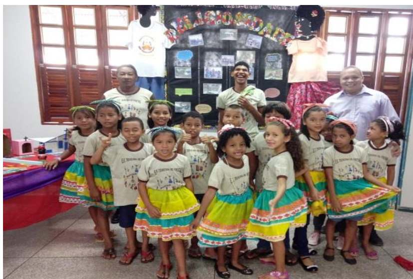
Figura 12- Turma do 3º ano - Religiosidade

quilombola e escolar, com a temática do projeto “Eu quilombola? Quem Sou? De onde vim? Para onde vou?”, na qual houve a contribuição da comunidade com suas vivências e experiências. Por fim, a apresentação cultural dos estudantes de series variadas, dançando ao mais tradicional ritmo da comunidade quilombola de São Pedro dos Bois, o Batuque, que dá nome ao Projeto. As imagens abaixo demonstram a exposição das atividades desenvolvidas pelas turmas do ensino fundamental I e II, a palestra ministrada por nós e a oficina de turbante realizada com a turma do 4º ano.