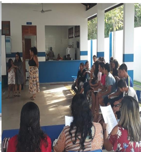
Figura 7 - Público da Palestra