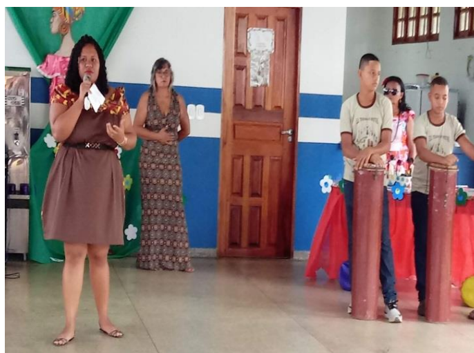
Figura 16 - Palestra: Eu Quilombola? Quem sou? De onde vim? Para onde vou?