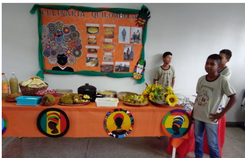
Figura 13 - Turma do 5º ano - Comidas Típicas