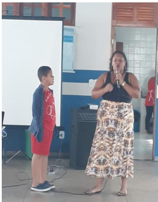
Figura 8 – Palestra: O Quilombola e a História