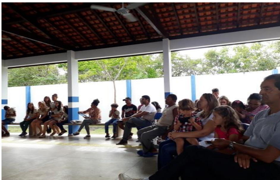
Figura 17 – A comunidade presente.