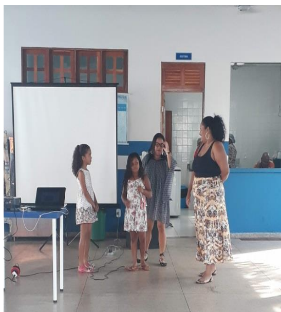
Figura 6 – Momento de pergunta dos alunos

O conteúdo foi ministrado de uma forma didática e despertou a curiosidade das crianças, que fizeram muitas perguntas e contribuições a partir de suas vivências. Considero tal experiência importante, pois demonstrou para professores/as, coordenação e pesquisadores/as, com certa amplitude, como estava o entendimento dos/as estudantes sobre as questões históricas e culturais relacionadas ao quilombo, local e nacionalmente. As perguntas feitas pelas crianças, em geral, eram sobre o contexto amplo da história como “O que significa quilombo?”, “Quem foi Zumbi dos Palmares?”, “De quem eu sou parente (descendente)?”, esses questionamentos revelam a curiosidade dos/as mesmos/as, pelos conceitos que geralmente ouvem e as noções de origem do povo quilombola. As imagens abaixo são registros feitos no dia 23 de novembro de 2018, dia da realização da palestra.