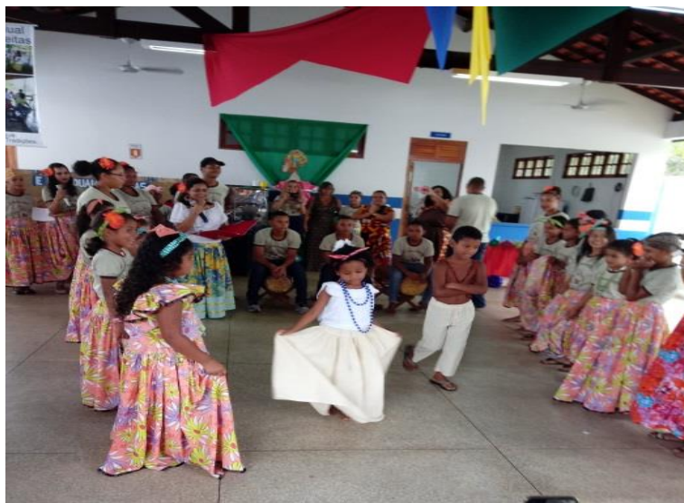
Figura 19 - Apresentação Cultural: Dança do Batuque - Estudantes de séries variadas.