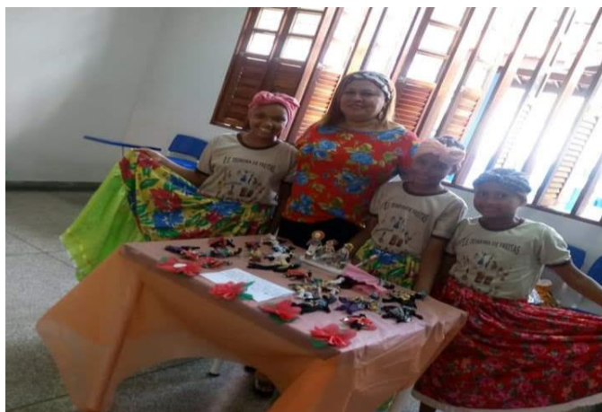
Figura 14 - Turma do 4º ano - Objetos Antigos