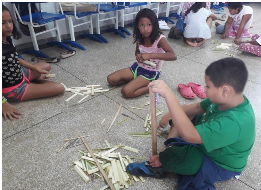
Figura 10 - Alunos do 4º ano produzindo casas de Miriti