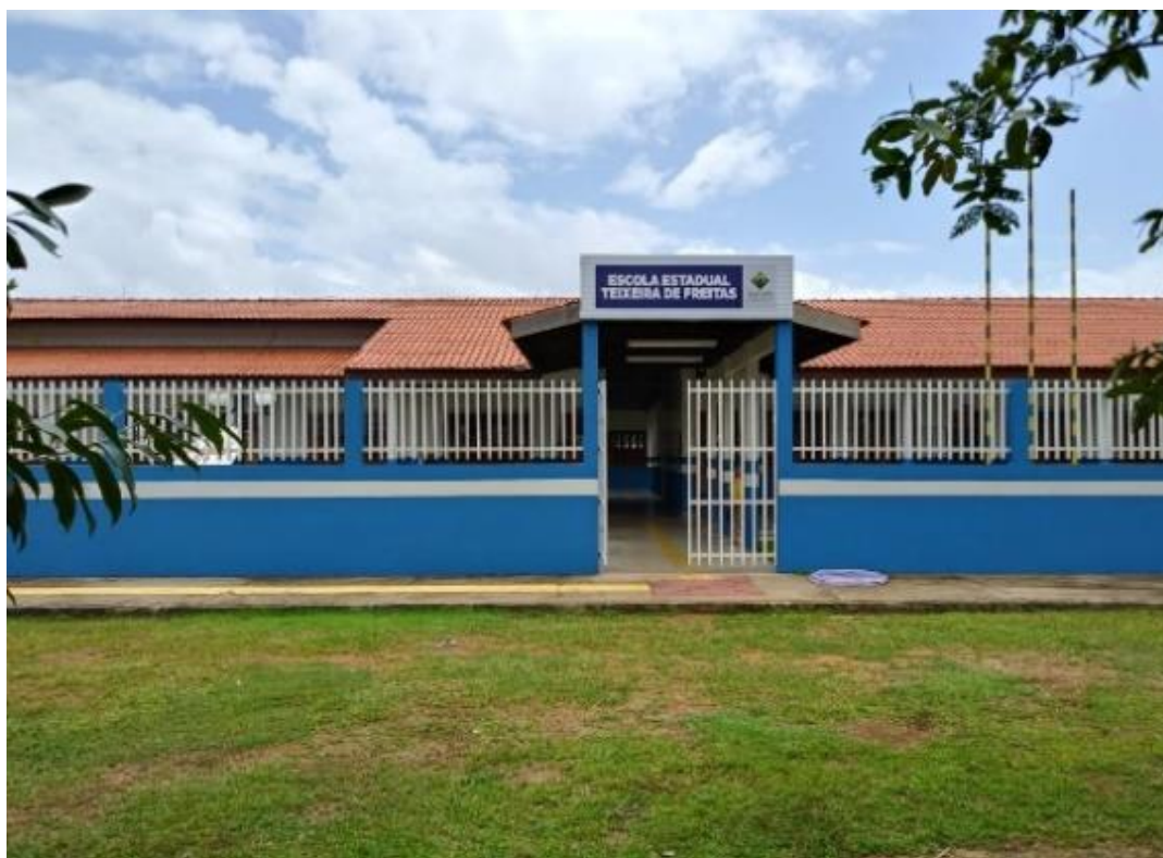
Figura 4 - Estrutura nova da escola, 2018.