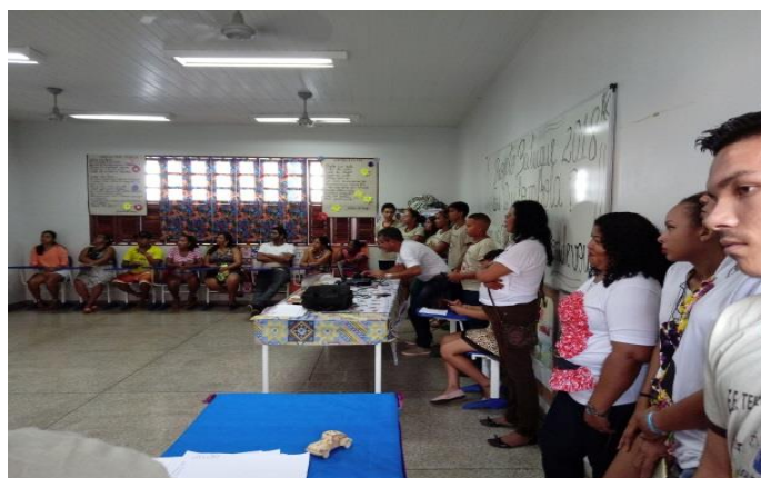
Figura 15 - Turma do 9º ano - Conceitos da História Quilombola